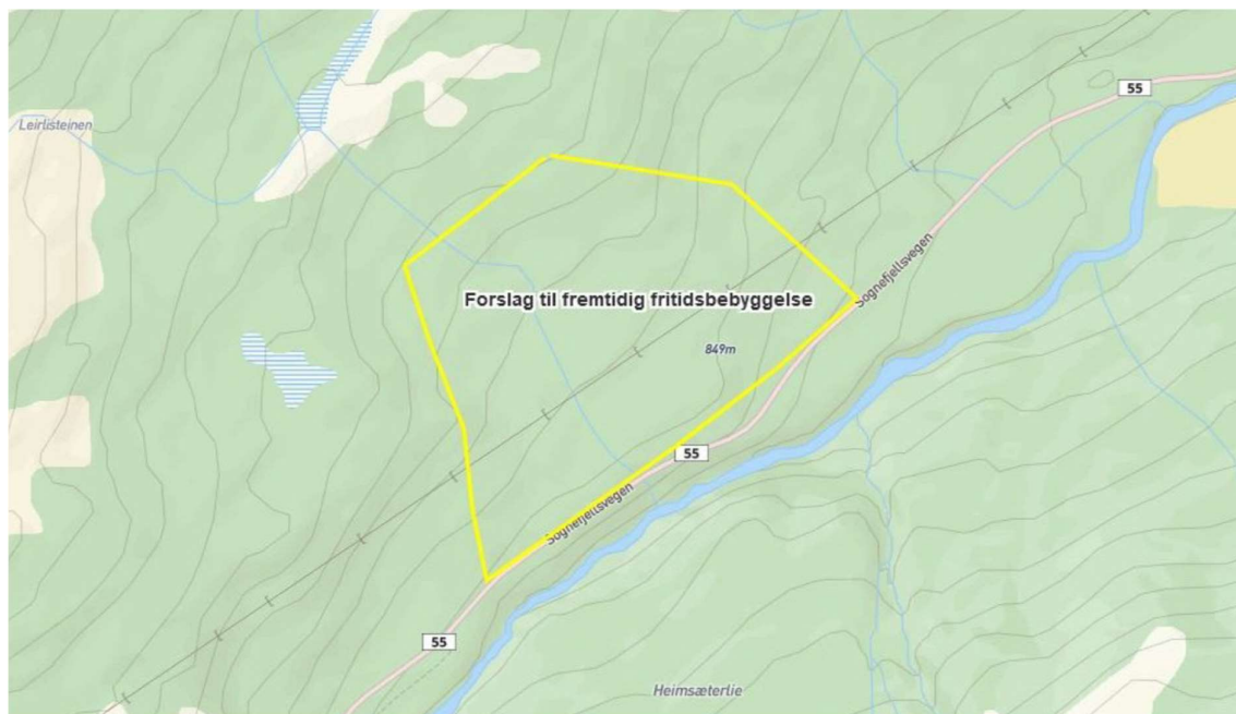
Framlegg til område for fritidsbustader på Gomobrennhaugen i Leirlie.

Feragen meiner det skal være mogeleg å etablere tilkomst i området. Han skriv det er noko bratt i området ned mot Sognefjellsvegen, men at han ser det kan vere mogeleg å nytte ein eldre skogsveg til ein kjem opp på eit noko flatare område omtrent 40-50 meter nord for Sognefjellsvegen.